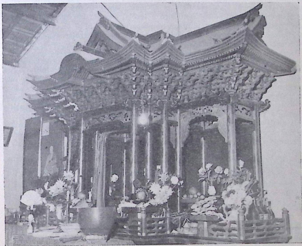
Altar principal do templo de Vila Piraporinha, onde é realizada, como parte das festividades, a missa em homenagem à «Maria Kannon».

O templo e as construções complementares construídas nesses dezessete anos — «casa das almas», residência do sacerdote, cozinha externa, banheiros também externos, depósitos de lenha e ferramentas, viveiros para criação de aves e animais de pequeno porte — bem como os pátios, jardins e horta (onde se vêem verduras variadas), e barracas especialmente montadas para