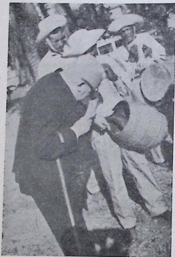
Fernando Ortiz, em São Paulo (1954), quando da realização do Congresso Internacional de Folklore, examina detidamente uma «cuica» do Espírito Santo.

É o fim de uma grande vida, de sabedoria, de trabalho, de amor à ciência e de simpatia humana, que registamos com a maior emoção. Morreu Fernando Ortiz, cuja obra foi um rasto luminoso no espaço americano. Extinguiu-se o foco, mas o claro perdurará para sempre e seu nome se inclui, gloriosamente, entre aqueles que dedicaram a vida toda a conhecer o homem americano, a sua vida, as suas origens. Foi um sábio no sentido mais perfeito da expressão, não só por ter sido um erudito, mas porque usou sua longa vida como instrumento do conhecimento. Não se limitou aos estudos, aprendeu vivendo e vivendo ensinou. Encerrando o Congresso Internacional de Folklore, de São Paulo, em 1954, lembrou que o diabo era mais sábio por ser velho e não por ser diabo. Nêle as duas condições se reuniram e a sua inteligência tinha aquela penetração mefistofélica e a sua velhice tinha a experiência de uma longa e profunda vivência.