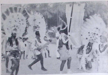
"Índios Tupi-Tamoios", de Cabedelo/PB — a única tribo que conserva a presença feminina.