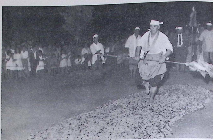
O sacerdote é o primeiro a passar sobre a esteira de brasas vivas.

Em pessoa, o monge Kanjun Nomura faz os últimos preparativos para terminar o «tapete», entoando orações, umas em voz alta, outras em surdina.