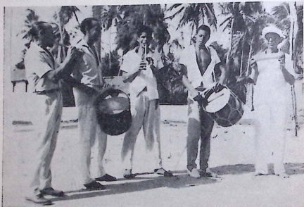
A orquestra típica, vendo-se da esquerda para a direita: pífano, zabumba, pífano, zabumba e ganzá. Em algumas tribos há também o triângulo.